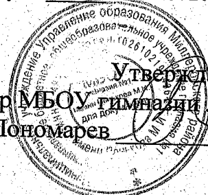
График работы комиссии общественного родительского контроля за организацией горячего питания обучающихся в МБОУ гимназии №1 в 2023-2024 учебном году.